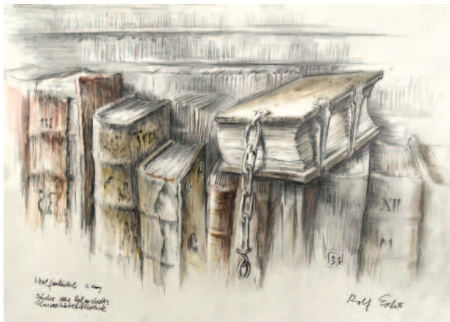
Kettenbücher, Bleistift und Farbstifte

Abb. Vorderseite: Auszug der Kettenbücher aus Kloster Bentlage, Bleistift und Farbstifte, 2022